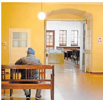
Einmal im Monat geht es zur Sitzung ins Ledigenheim.

Im Aufenthaltsraum hinter der Drehtür sitzen jene, die gerade von der Schicht kommen oder sich frisch geduscht noch irgendwas zum Mund führen. Viele ältere Männer sind dabei, der Qualm ihrer Fluppen hängt in der Luft. Dem einen stehen die staubigen Haare zu Berge, der andere fixiert, die fleckigen Malerklamotten noch am Leib, das Smartphone in der Hand, aus dem irgendein TV-Programm in osteuropäischem Sound die Lobby beschallt. Gleich links vorne am Eingang